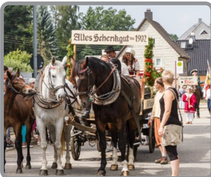
Umzug 725 Jahre Bräunsdorf 29.08.2015