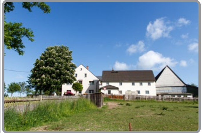
Gut der Familie Reichenbach