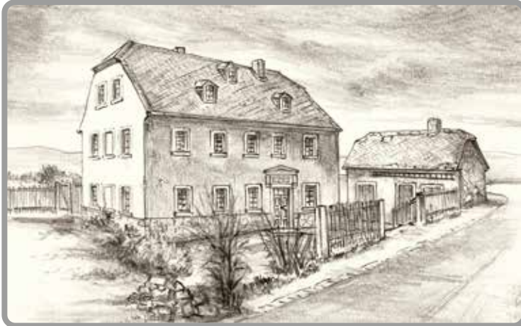
Die Kirchschule, Bleistiftzeichnung S. Frenzel