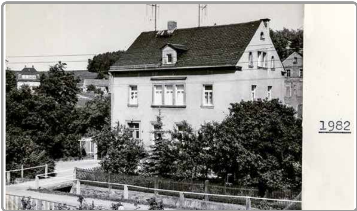
Obere Schule - heute Wohnhaus Familie Frenzel