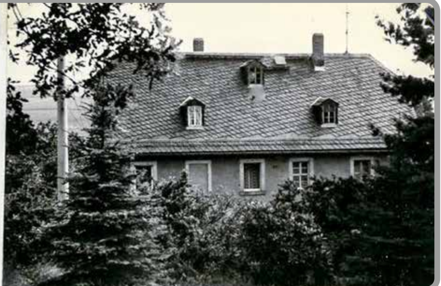
Blick vom Friedhof (Nähe der Eiche) 16.8.1980