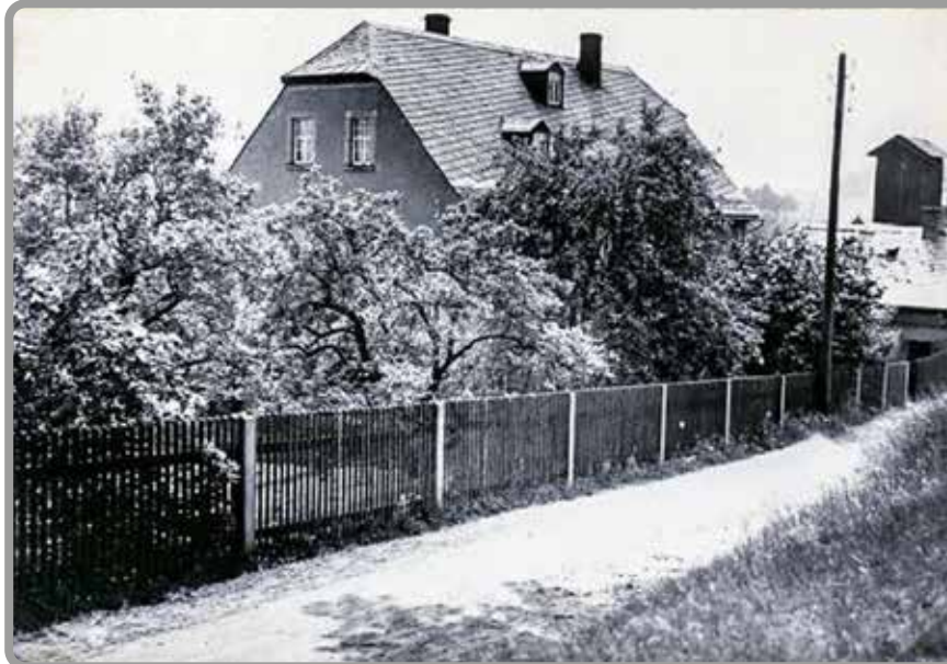
Blick vom Tor zum Friedhof Juni 1937