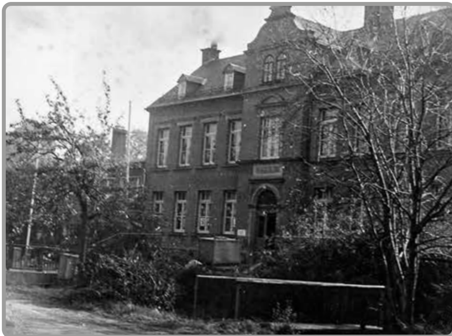
Zentralschule 1990

Damals engagierte sich der Ortspfarrer Dr. Jacob auch für den Bestand der Schule in Bräunsdorf