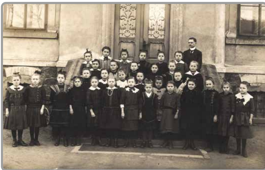
Schulklasse nach 1905, genaues Datum unbekannt.