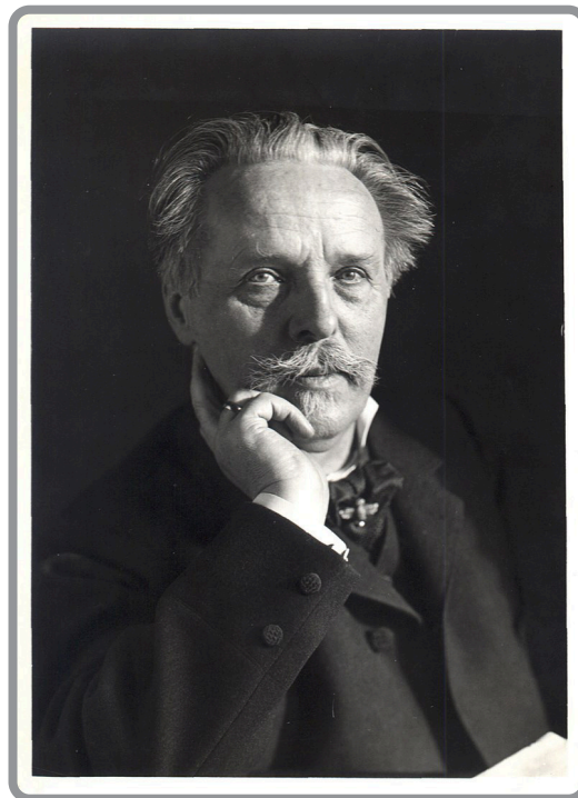
Karl May 1907