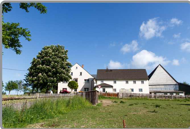
Gut der Familie Reichenbach, ehemals Erbschenke